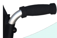
Puños de goma-espuma