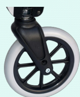
Rueda delantera 200 mm.