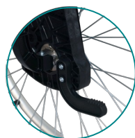
Palanca de pie