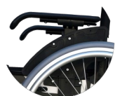
Reposabrazos desmontables Rectos largos

Los reposapiés regulan su altura sin necesidad de herramientas, siendo además escamoteables hacia dentro o fuera y extraíbles.