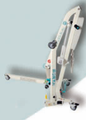
PLUMA Y PATA PLEGADA