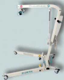
PLUMA A MEDIO